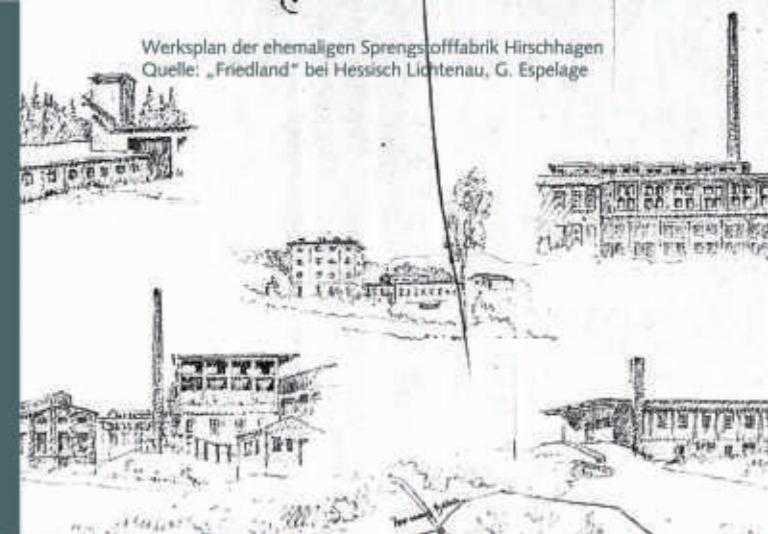
Werksplan der ehemaligen Sprengstofffabrik Hirschhagen