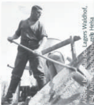
Arbeiter bei Bau des Lagers Waldhof.