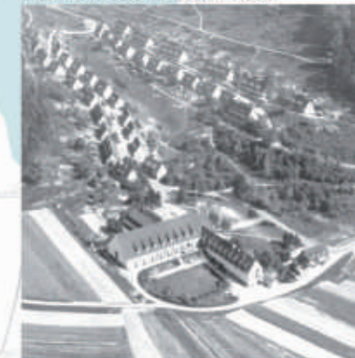
Luftbild Waldhof vor 1960